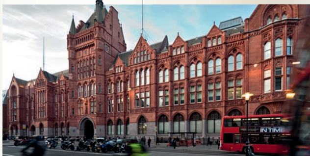
Holborn Bars – siedziba Prudential w Londynie

Według stanu na dzień wybuchu wojny w Polsce funkcjonowały 4623 polisy Prudential. Obietnice Towarzystwa Prudential w Polsce nie wygasły jednak wraz z wybuchem wojny. Pomimo tego, że firma nie mogła kontynuować normalnej działalności w powojennej komunistycznej Polsce i że wojna praktycznie zniszczyła archiwum firmy, od roku 1948 do dziś trwają poszukiwania spadkobierców posiadaczy dawnych polis i wypłaty pieniędzy. Dbając o to, by dotrzymać danego kiedyś słowa, stworzyliśmy i stale uaktualniamy listę poszukiwanych spadkobierców przedwojennych polis ( www.prudential.pl/historia ).