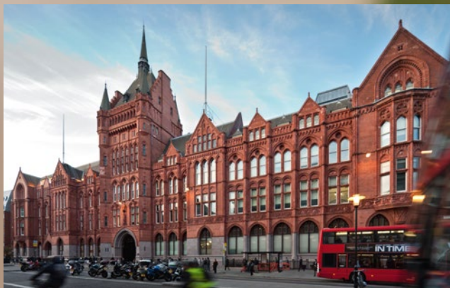
Holborn Bars – siedziba Prudential w Londynie

Według stanu na dzień wybuchu wojny w Polsce funkcjonowały 4623 polisy Prudential. Obietnice Towarzystwa Prudential w Polsce nie wygasły jednak wraz z wybuchem wojny. Pomimo tego, że firma nie mogła kontynuować normalnej działalności w powojennej komunistycznej Polsce i że wojna praktycznie zniszczyła archiwum firmy, od roku 1948 do dziś trwają poszukiwania spadkobierców posiadaczy dawnych polis i wypłaty pieniędzy. Dbając o to, by dotrzymać danego kiedyś słowa, stworzyliśmy i stale uaktualniamy listę poszukiwanych spadkobierców przedwojennych polis ( www.prudential.pl/historia ).