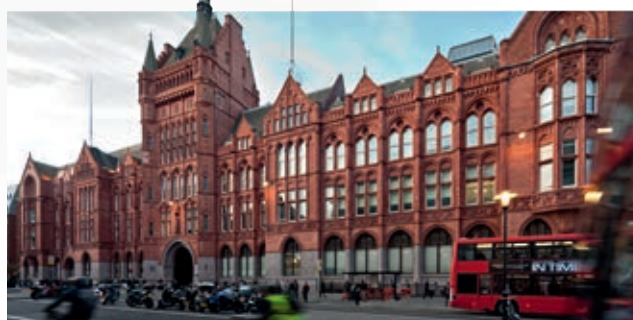
Holborn Bars – siedziba Prudential w Londynie

Według stanu na dzień wybuchu wojny w Polsce funkcjonowały 4623 polisy Prudential. Obietnice Towarzystwa Prudential w Polsce nie wygasły jednak wraz z wybuchem wojny. Pomimo tego, że firma nie mogła kontynuować normalnej działalności w powojennej komunistycznej Polsce i że wojna praktycznie zniszczyła archiwa firmy, od roku 1948 do dziś trwają poszukiwania spadkobierców posiadaczy dawnych polis i wypłaty pieniędzy. Dbając o to, by dotrzymać danego kiedyś słowa, stworzyliśmy i stale uaktualniamy listę poszukiwanych spadkobierców przedwojennych polis ( www.prudential.pl/historia ).